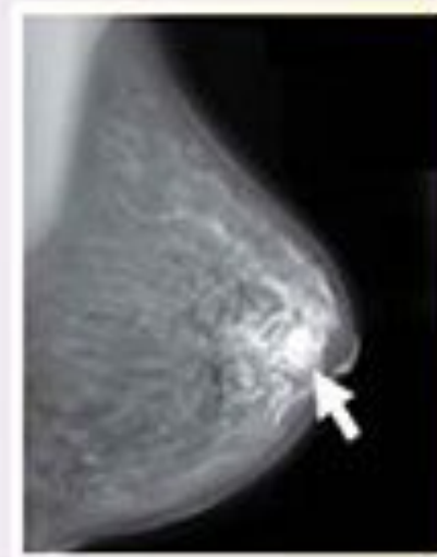
Bệnh ung thư