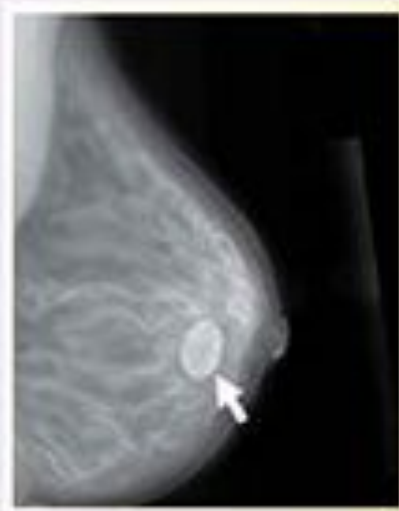
Lành bào xác